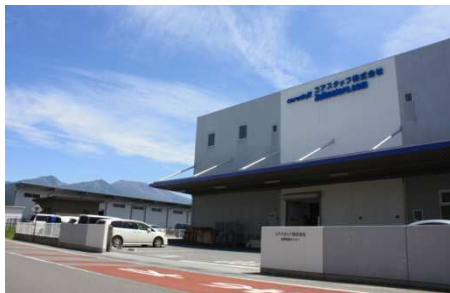
長野物流センター