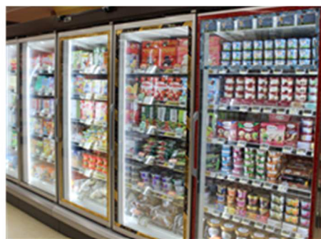
高効率冷蔵冷凍ショーケース導入