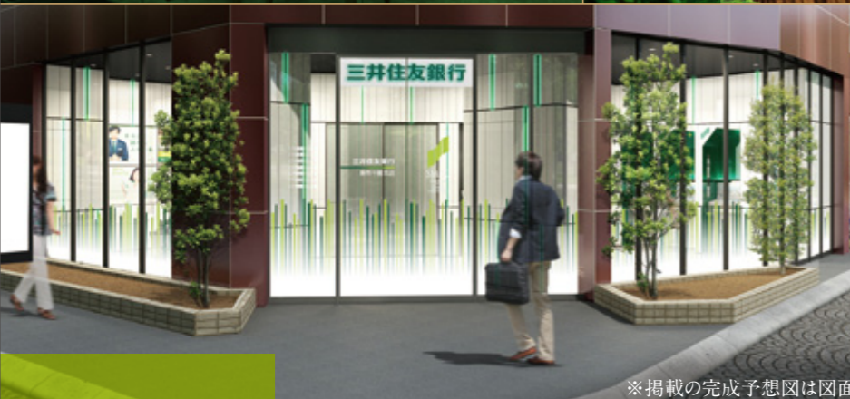
※掲載の完成予想図は図面を基に描き起こしたもので、外観や内装、設備機器等、実際とは異なります。