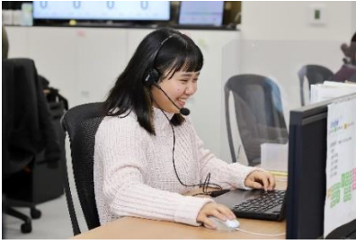
ECH 株式会社で活躍する 女性社員