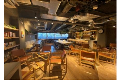
オフィス内の カフェスペース

三井住友銀行では、「SMBC なでしこ融資」により、お客さまの女性活躍推進に向けた取組みを、金融を通じて応援してまいります。