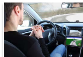
運転の自動(自律)化