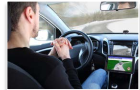
運転の自動(自律)化