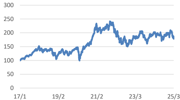
ROBO Global Robotics and Automation UCITS指数 (税引後配当込み、円ヘッジあり、円ベース)