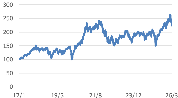
ROBO Global Robotics and Automation UCITS指数 (税引後配当込み、円ヘッジあり、円ベース)