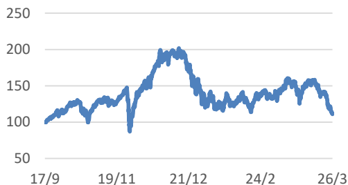
ファクトセット・グローバル・フィンテック・インデックス (配当込み、円ヘッジあり、円ベース)