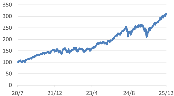
MSCI-WORLDインデックス (税引後配当込み、円ヘッジなし・円ベース)