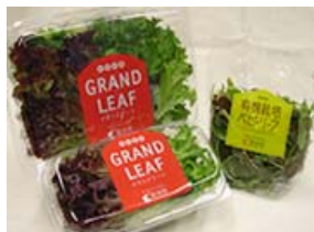
商品のベビーリーフ