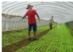
有機 JAS 認定の自社農場