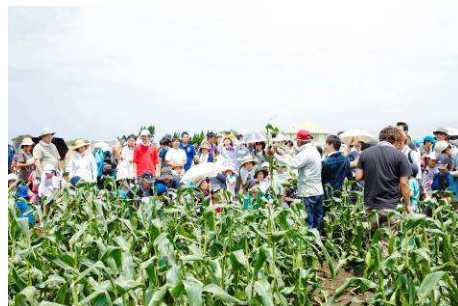
年 100 回近く開催している 産地との交流イベント