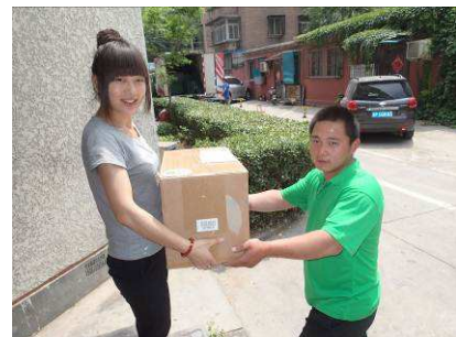
2013 年 5 月に開始した 北京での宅配事業