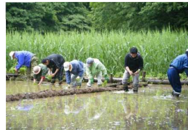
環境保全活動 (天覧山谷津田での田植え)