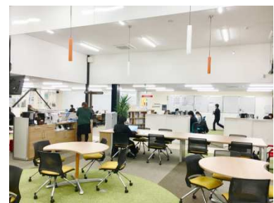
山梨工場オフィスの フリースペース