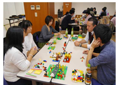
管理職員のマネジメント能力向上に向けた研修