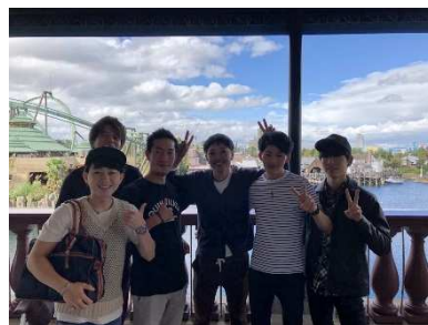
リフレッシュを目的に施設外研修を実施