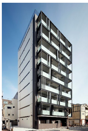
耐震性に優れた 新耐震基準 RC 造

三井住友銀行では、「SMBC事業継続評価融資」により、有事における企業の事業継続対応のための体制構築を支援するとともに、企業のリスク管理の取組を金融の立場から支援することで、持続可能な社会の実現に貢献してまいります。