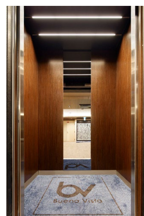
最新の地震揺れ対応 エレベーター